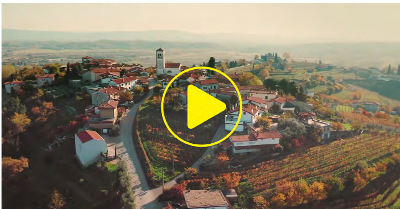
El kit de herramientas rural, una guía sobre la financiación de la UE para las zonas rurales

Iniciativas así buscan asegurar que los técnicos y agentes locales del medio rural dispongan de la información y capacitación necesarias para identificar y aprovechar los fondos europeos en beneficio de sus comunidades.