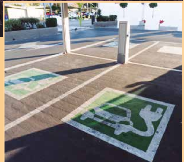
Reducción de la contaminación lumínica y movilidad sostenible son las líneas de proyecto más frecuentes.

El objetivo del PROGRAMA DUS 5000 es dar un impulso al Desarrollo Urbano Sostenible en los municipios de reto demográfico mediante actuaciones en cinco líneas: rehabilitación energética, autoconsumo, climatización renovable, alumbrado y reducción de contaminación lumínica, y movilidad sostenible. Entre los proyectos presentados, las dos últimas líneas son las más frecuentes