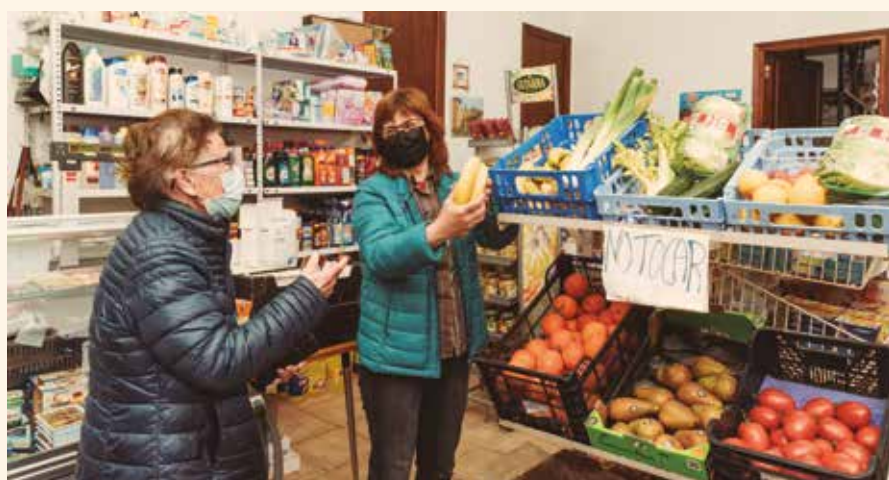
Multiservicios en la provincia de Teruel.