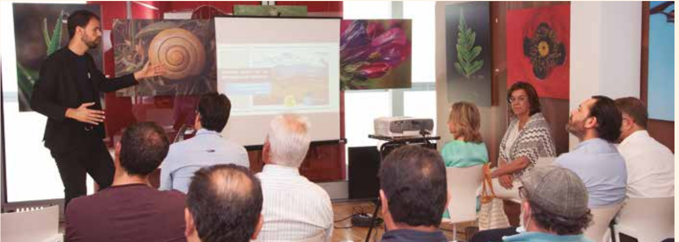
Primeras reuniones celebradas por Alcaldes de la provincia de Palencia en el marco del proyecto piloto de la Diputación de Palencia.