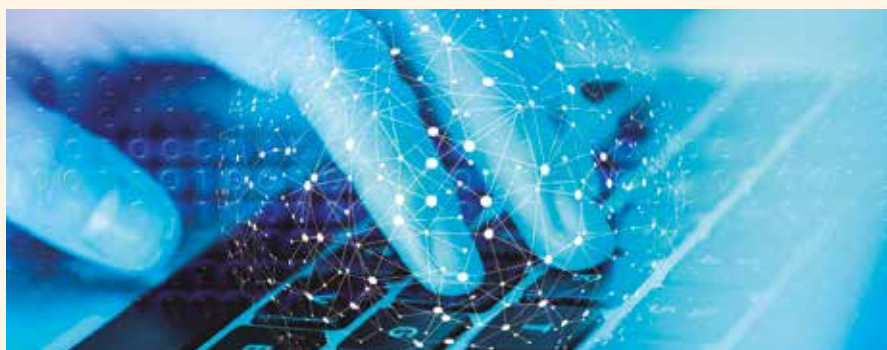
El primer eje de actuación del proyecto de la Diputación de Cáceres pasa por la capacitación digital y mejorar la alfabetización tecnológica de los profesionales del comercio rural.

El proyecto tiene como ámbito de actuación los 211 municipios de la provincia de Cáceres con menos de 5.000 habitantes.