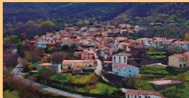
Cantagallo y Puerto de Béjar, dos de los municipios de la Mancomunidad de la Ruta de la Plata.